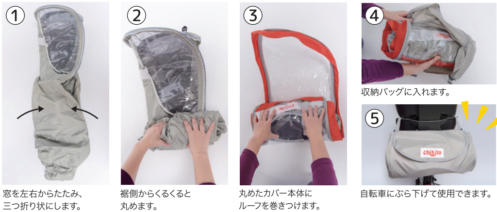
① 窓を左右からたたみ、三つ折り状にします。 ② 裾側からくるくると丸めます。 ③ 丸めたカバー本体にルーフを巻きつけます。 ④ 収納バッグに入れます。 ⑤ 自転車にぶら下げて使用できます。

つけっぱなしでご使用いただけますが、収納する場合は、以下の手順でたたむことができます。